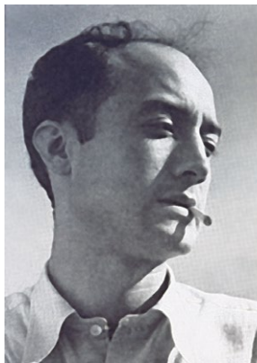
Скульптор Исаму Ногучи, любовник Фриды. 1935.