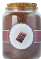
КАКАО-ПОРОШОК БЕЗ САХАРА