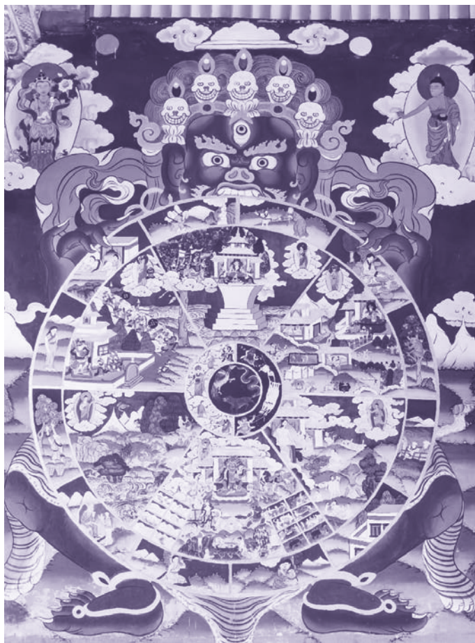
Колесо Сансары. Настенная роспись в буддийском монастыре Ринпунг-дзон, Бутан

С последним выдохом жизненная сила [ прана ] погружается в центр мудрости [в сердечную чакру ], и познающий начинает переживать природный ясный свет, свободный от умопостроений. Затем, если жизненная сила отбрасывается назад и ускользает в правый и левый каналы, сразу же наступает промежуточное состояние.