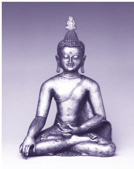
Медитирующий Будда Шакьямуни. Центральный Тибет. XII в.

Вначале нужно освоить на собственном опыте предварительные практики, «Руководства», предназначенные для освобождения людей.