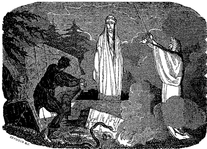
Не будите мертвых. Иллюстрация для книги «Легенды ужаса». Роберт Сеймур, 1826

и мертвы в одно и то же время; они способны размножаться, но лишены благословенного дара смерти» 9 .