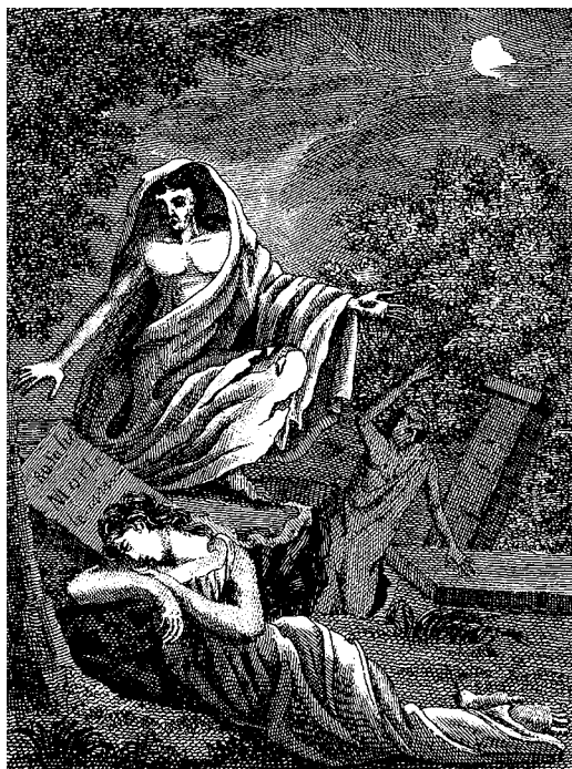
Вампир. Иллюстрация из книги Коллена де Планси «Истории вампиров и злых духов, дополненной исследованием проблемы вампиризма», 1820

Ганс Гейнц Эверс* и Теофиль Готье 1 . Кинематографическая история вампиров началась в 1913 г. с картины итало-американского режиссера Роберта Виньола «Вампир», а «жалованную грамоту» на признание вампирской теме принес немой фильм ужасов немецкого режиссера Фридриха Вильгельма Мурнау «Носферату. Симфония ужаса» (1922), где жертва отважно удерживает вампира до рассвета и тот погибает в жгучих лучах солнца. В 1930–1940-е гг. выходит как минимум семь кинокартин про