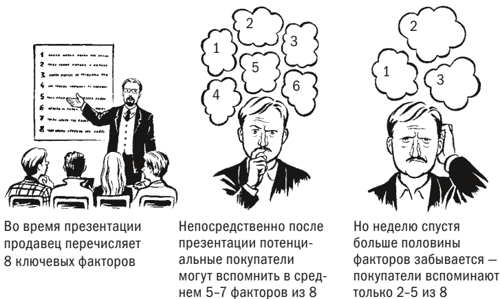
Рис. 2.1. Какой объем информации из презентации запоминают

К сожалению, лишь малая часть ожиданий оправдалась. Нас пригласили выяснить причины. Мы попросили группу потенциальных покупателей посмотреть демонстрацию и сразу же ответить на несколько вопросов. Сценарий представлялся очень удачным — в среднем покупатели запомнили 5–7 ключевых пунктов из 8 возможных. Спустя неделю мы посетили каждого из них, и оказалось, что больше половины информации утеряно (см. рис. 2.1).