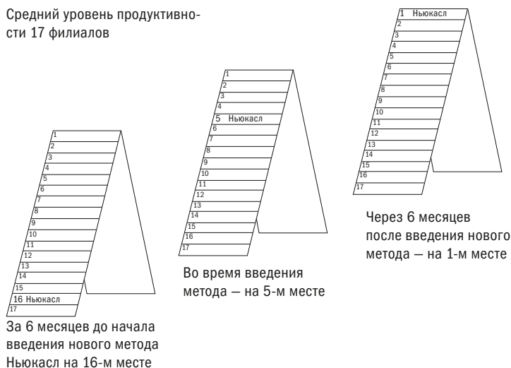
Рис. 2.3. Изменения продуктивности филиала в Ньюкасле

Средний уровень продуктивности 17 филиалов