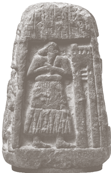
Стела Ушумгаля и Шара-игизи-Абзу, 2900–2700 гг. до н. э.

Важнейшие для власти идеи, формирующие общественное сознание, утверждались именно через миф. Поэтому большинство шумерских космогонических текстов относится к одной группе памятников, составленных жрецами III династии Ура. Речь идет о «школьном каноне Ниппура» — произведениях, записанных в Ниппуре, одном из ведущих центров обучения писцов. В целом на сегодня восстановлено более двухсот табличек с литературными текстами. К ниппурскому канону относятся девять сказаний о подвигах героев Энмеркара, Лугальбанды, Гильгамеша. Чаще всего в этих мифах упоминаются города Эриду, Урук и Ур, жители которых почитали Ниппур как традиционное место общешумерского культа.