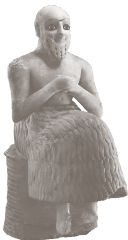
Статуя Эбих-Иля, посвященная богине Инанне (Иштар), Мари, 2500–2340 гг. до н. э.

Считалось, что верховные боги были слишком заняты, чтобы заниматься судьбами простых людей. Обратиться непосредственно к таким божествам, как Ан, Энлиль, Энки, Инанна и Уту, могли только правители, верховные жрецы и высшие чиновники. Выслушав просьбу молящего, верховный бог передавал ее божеству, наделенному особыми силами в разрешении поставленного вопроса. Существовали также посредники между