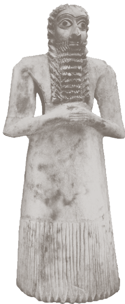
Вотивная фигурка шумера из Эшнунны, 2900–2600 гг. до н. э.

В божественном покровителе города представления о власти военного вождя общины соединяются с функциями верховного