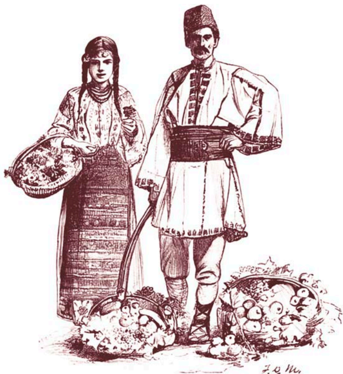
Румынские крестьяне продают цветы и фрукты. Альфред Парсонс, 1892 г.

был снова черед глупого черта, и опять хромого, но теперь тот брат, у которого ноги были в полном порядке, оценил по достоинству покой, испытанный в повозке, и решил, что лучше бы ему и дальше прохладиться, а сородич пусть навсегда останется узником глиняного коня. Не тратя много времени на размышления, он его там и запер, а сам расселся в повозке, довольный.