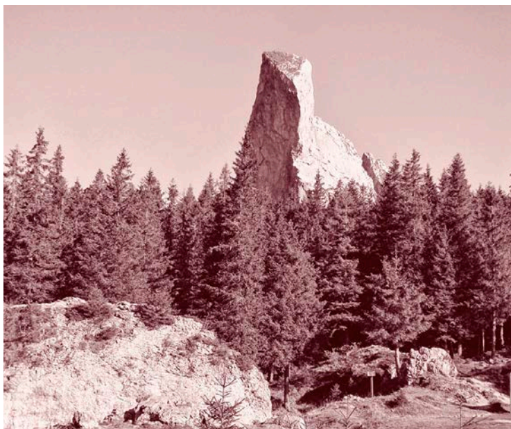
Пятра-Шоймулуй (Камень сокола). Горы Рарэу.

И с той поры на горах Рарэу трава не растет; они пламенем обожжены и, когда настанет час, попадут прямиком в ад.