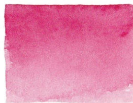
Rose Madder PR146