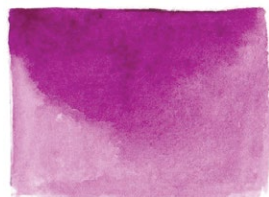
Red Violet PR81/PV3