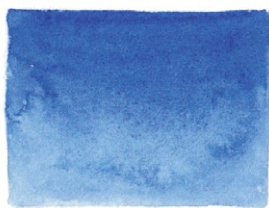
Ultramarine Light PB29