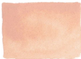
Jaune Brilliant PO13/PW6