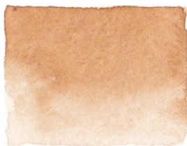
Yellow Ochre PY42/PY43