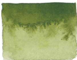
Olive Green PG8/PY1/PY2