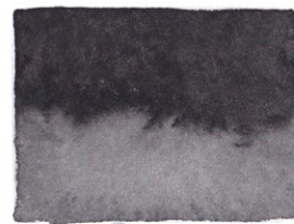
Ivory Black PBk6/PBk9