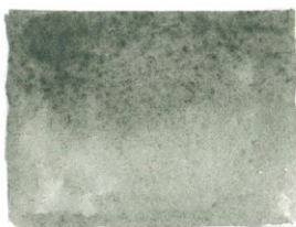
Davy's Grey PBk31/PG17/PW6