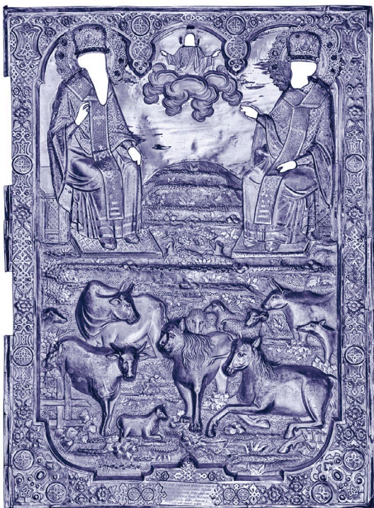
Оклад иконы «Святые Власий и Спиридоний». Неизвестный мастер, XIX в.

принятия христианства непосредственным продолжением образа Мокоши стал образ Параскевы Пятницы 19 .