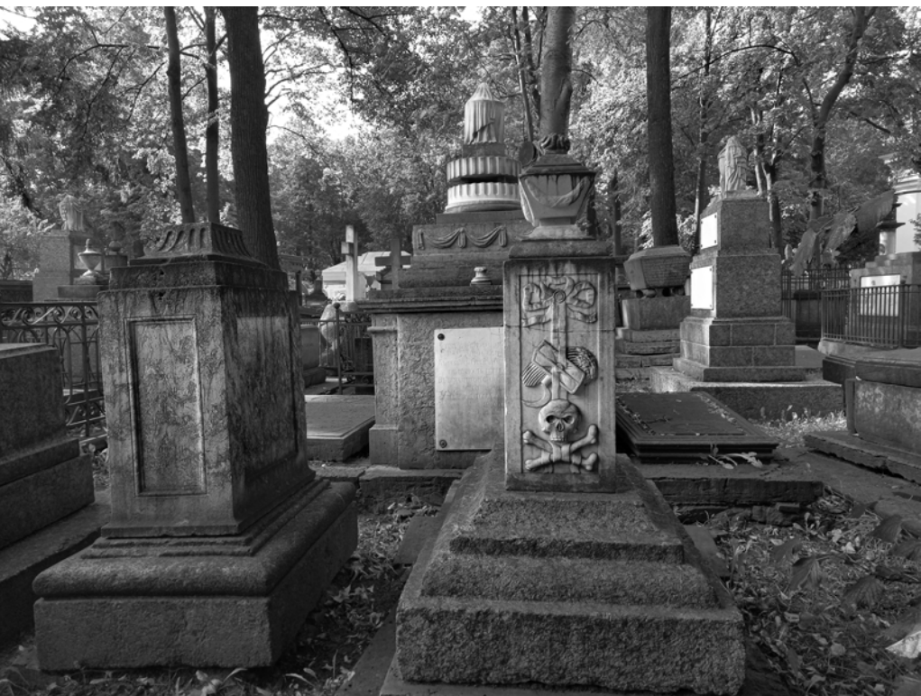
Лазаревское кладбище Александро-Невской лавры.

кладбище получило название Лазаревского*. К концу XVIII века его границы были определены каменной оградой, и захоронения там продолжались до начала XX века. За стенами Александро-Невской лавры в середине XVIII века существовало отдельное кладбище «попроще» — для жителей близлежащих районов**. Никаких следов от него не осталось.