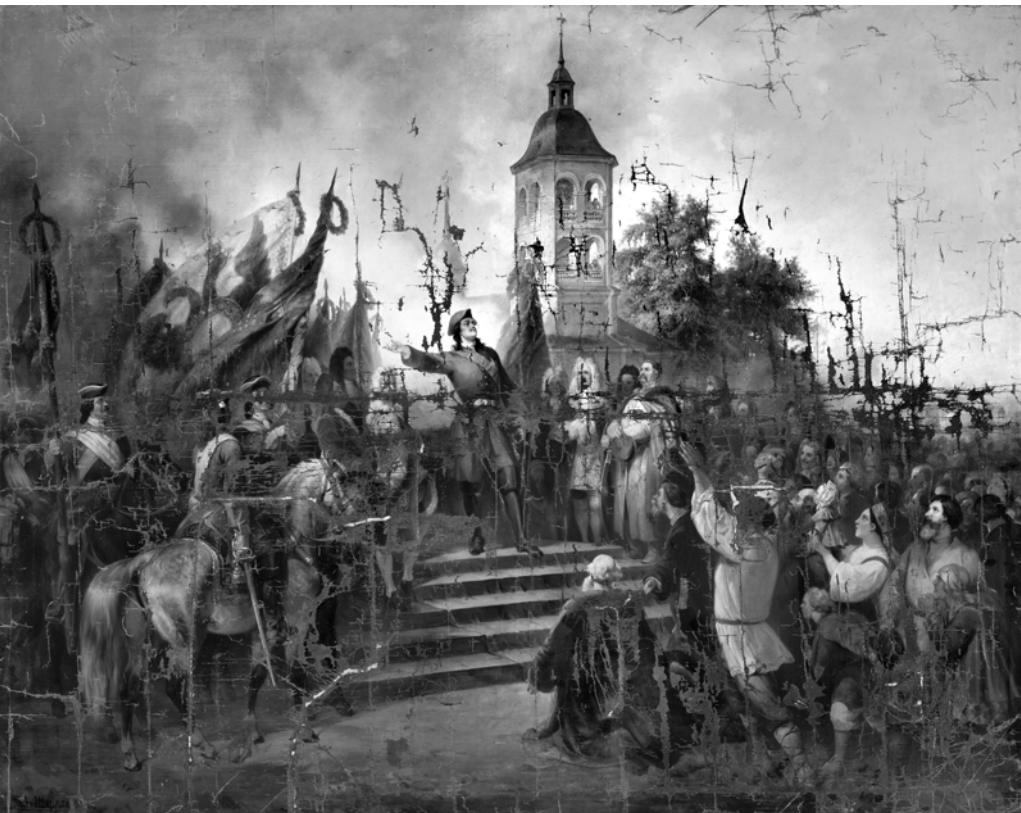
Петр I объявляет народу мир со Швецией, Государственный Эрмитаж, 1860

Первые погребения проходили в Благовещенской церкви монастыря (позднее она многократно перестраивалась): в 1710–1720 годах там по особому разрешению хоронили только приближенных к Петру I военачальников и знатных людей. В Лазаревской церкви также хоронили приближенных Петра и даже его родственников: сестру Наталью Алексеевну и сына Петра Петровича, скончавшегося в младенчестве. Хоронили не только в церквях, но и внутри монастырских стен — это