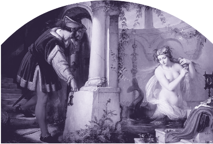
Мелюзина. Картина Юлиуса Губнера. 1844 г.

миновала Шварцвальд и Арденны* и наконец добралась до леса Коломбье в Пуату**, где все местные феи явились к ней и провозгласили ее своей королевой.