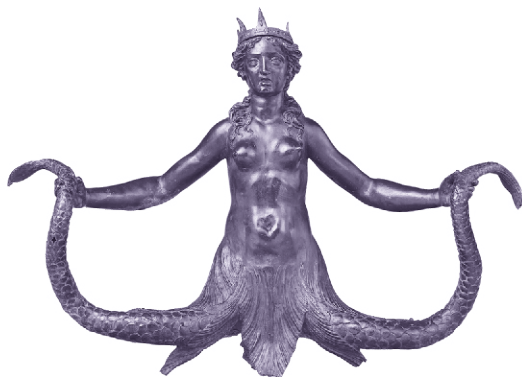
Двуххвостая сирена. Бронзовая фигурка. Италия, ок. 1600 г.

нем трансформируются: на иллюстрациях драконий или змеиный хвост Мелюзины постепенно превращается в хвост русалки, а затем в два рыбьих хвоста. Этот переход от полуженщины-полузмеи к русалке объясняется тем, что д'Аррас поместил Мелюзину около воды — сначала она появляется возле родника, а затем в ванне; кроме того, у змей и драконов, как и у рыб, имеется чешуя. С точки зрения христианской религии подобная трансформация придает образу Мелюзины позитивную коннотацию, ибо вода и рыба считаются символом искупления, тогда как драконы остаются демоническим воплощением. В начале XIX века один из вариантов этой истории стал национальным мифом об основании Люксембурга — двуххвостая Мелюзина фигурирует в нем вместе с прародителем нации Зигфридом в роли Раймондина.