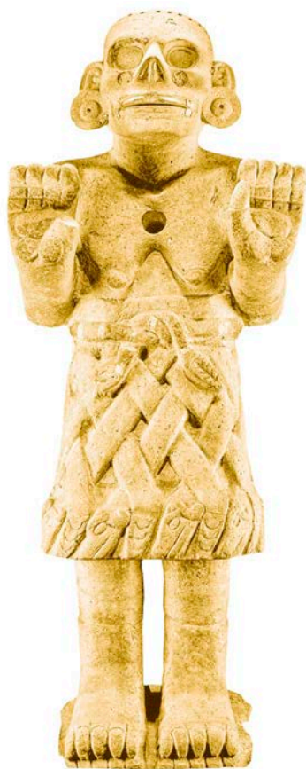
Коатликуэ. Ок. 1325–1521 гг. н. э.