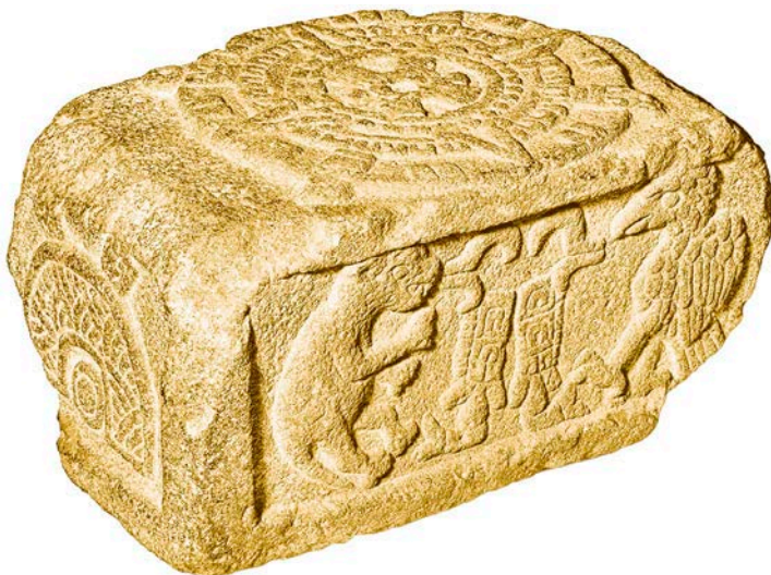
Алтарь воина Солнца. Пуэбла, Мексика, ок. XV–XVI вв.

источниках. Это объясняется многочисленными наслоениями более поздних и ранних религиозно-мифологических представлений науа.