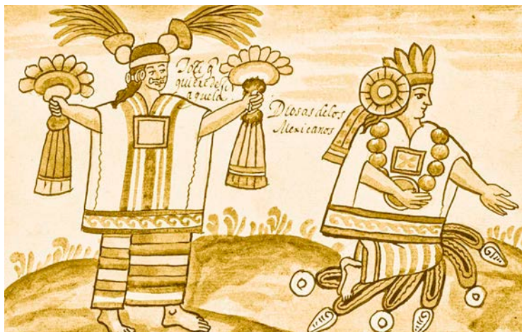
Тоси и Шочикецаль. «Кодекс Товара»

С чего же все началось? «История мексиканцев по их рисункам» рассказывает нам о существовании божественной пары — Тонакатекутли и Тонакасиуатль (Шочикецаль), «которые сами создали себя и постоянно пребывали на тринадцатом небе; о чьем происхождении ничего не известно, за исключением того, что их пребывание и сотворение было на тринадцатом небе»*. В других версиях этого мифа пара первых богов-создателей носит имена Ситлалатонак и Ситлаликуэ.