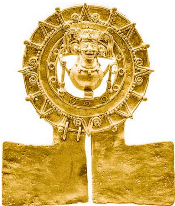
Нагрудное украшение из золота с изображением солнечного диска. Саачила, Оахака, постклассический период

Важность Солнца для религиозно-мифологических представлений древних жителей Мексики подтверждается целым рядом археологических (знаменитый ацтекский Камень Солнца) и письменных источников (работы испанских хронистов и ацтекские кодексы).