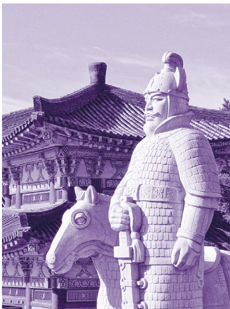
Каменный страж и его конь перед гробницей короля Чумона (Тонмёна) в Пхеньяне, КНДР

тем лучше. Полный комплект всех элементов чудесного рождения, которые не считаются ни с географическими особенностями регионов, ни с логикой и развитием религиозных верований на полуострове, представлен в сконструированном позднем мифе о происхождении короля Ван Гона. Основатель новой династии должен был превосходить всех современников, и анонимные чиновники, которым, хочется верить, платили рисом за каждый иероглиф, на комплименты не поскупились. Проблема лишь в том, что биография Ван Гона и его предков записана в королевской летописи «История Корё» (« Корёса ») и потому представляет собой официальное изложение вымышленных событий.