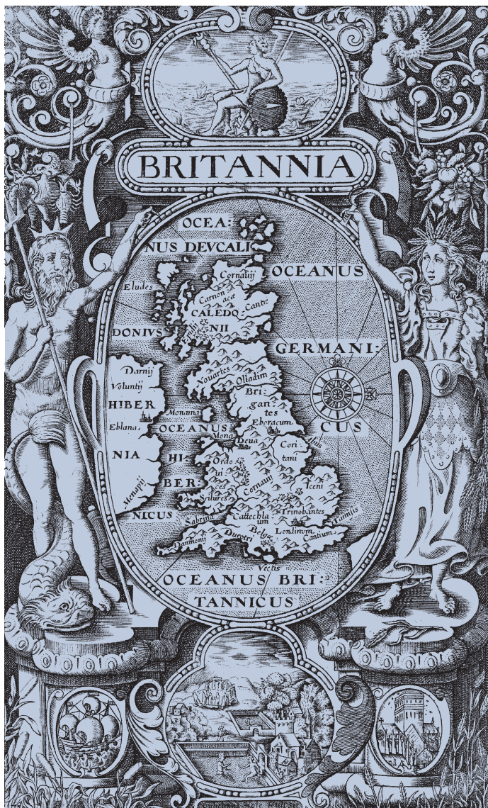
Карта Британии, или наиболее процветающих королевств — Англии, Шотландии и Ирландии, а также прилегающих земель. Уильям Кэмден, 1610 г.