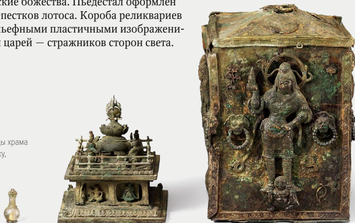
Реликварий из пагоды храма Камынса. 682. Кёнчжу, Республика Корея

Почитать описание, рецензии и купить на сайте МИФА