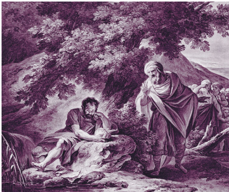
Демокрит среди адберитов. Франсуа-Андре Винсент, ок. 1784