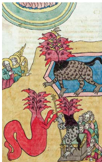
Миниатюра из лицевого Апокалипсиса с комментариями Андрея Кесарийского: Антихрист-Зверь выходит из моря, Дракон передает власть Зверю, XIX в.

году на другом конце империи, в Тюменском уезде, из-за проповеди странника жители целого села вечером вымылись в банях, надели саваны и всю ночь просидели на крышах изб в ожидании, когда с неба станут падать камни. Утром слезли на землю. Самое интересное, что они не были раздосадованы своим легковерием. Наоборот, радовались: «Слава Богу, пронесло!» 173