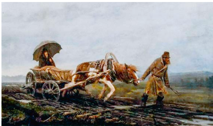
По бездорожью в Тверской губернии. Земский врач. Картина И. И. Творожникова, конец XIX в.

вреда. Кажется, от этого в народе зародилась мысль, что оспе нужно задобрить и подкупить и тогда она станет ласковой, не погубит и не покалечит ребенка. В деревнях ее встречали как дорогую гостью: пирогами, водкой и хлебом-солью в надежде, что оспа останется довольной и не будет лютовать.