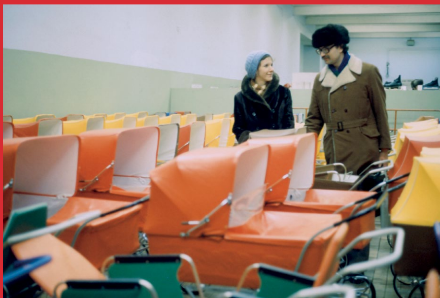
Отдел колясок. 1979 г.