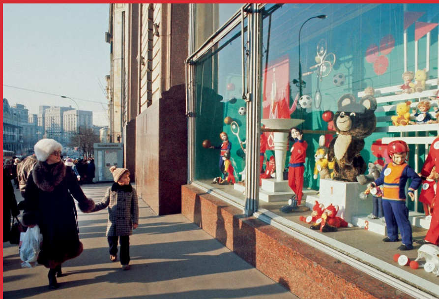
Витрина «Детского мира». 1979 г.