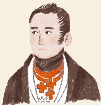
Валериан Емельянович Галямин, топограф и художник

Но кто их видел, этих чертей? А вот Северная Двина, и набережная, и старые деревянные дома — настоящие. Многие из архангельских домов похожи на сказочные терема, но и среди них есть особенные — с жуткой тайной, спрятанной в стенах. Говорят, что брёвна, из которых построены такие дома, были когда-то деревьями в священных рощах древнего народа чудь, проживавшего в этих краях. Рубить деревья в священных рощах и строить из них дома ни в коем случае нельзя,