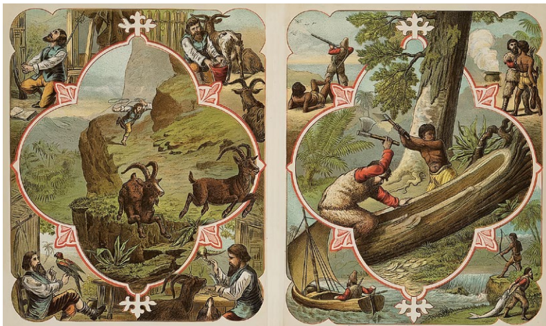
Иллюстрация к книге «Робинзон Крузо». Альбертус, 1876 г.

История Робинзона Крузо — хрестоматийный пример сюжетов сразу двух типов: «Туда и обратно» и «Приключение»