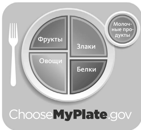
Рис. 1.2. Графическое изображение здорового рациона на сайте MyPlate

Однако мы кое-что дополнили и добавили пояснения, чтобы было удобнее и проще использовать рисунок при выборе продуктов (рис. 1.3).