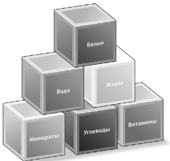
Рис. 1.1. Питательные элементы

Проще говоря, все, что мы едим и пьем, — это источники питательных элементов, необходимых для здоровья. Эти кирпичики организм использует для строительства тканей, регуляции химических процессов, повышения иммунитета, а также генерации энергии для обогрева и движения. Уже довольно давно ученые выделяют в пище важные для нашего организма строительные блоки: белки, разные виды углеводов, витамины, минералы, воду — и да, даже жиры (рис. 1.1).