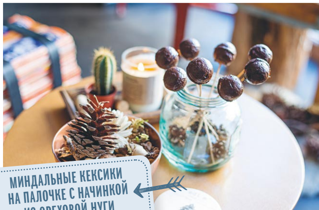
МИНДАЛЬНЫЕ КЕКСИКИ НА ПАЛОЧКЕ С НАЧИНКОЙ ИЗ ОРЕХОВОЙ ЛУГИ