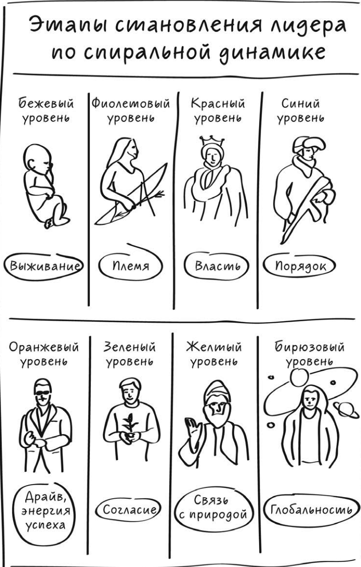
Рис. 1.2. Этапы становления лидера по спиральной динамике