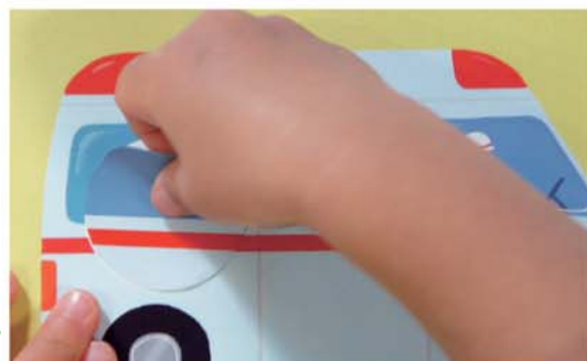
Ребёнок держит наклейку за краешек и пытается приклеить её на специально обозначенное место.

● Возможно, ваш малыш уже играл с наклейками, но приклеивал их куда придётся. Сначала ему будет трудно приклеивать наклейки на специально обозначенные места. Однако спустя время он научится делать это безошибочно.