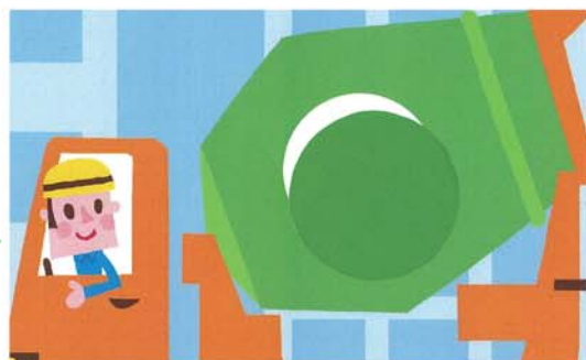
Не беда, если малыш приклеил наклейку неровно. Со временем он научится совмещать края наклейки и белой области.