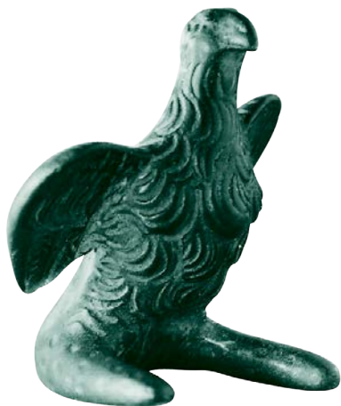
Рис. 51. Бронзовая фигура орла из римско-британского храма в Вудитоне, Оксфордшир

Сложность этой истории в том, что она представляет собой скрытый миф о добре и зле. Потому что Блодейвет не была смертной женщиной из плоти и крови, она была в корне порочна, недостойна доверия и в конечном счете слишком опасна, чтобы находиться среди людей. Способный оборачиваться птицей Ллеу носил имя, означавшее «Яркий», а имя его