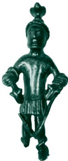
Рис. 43. Бронзовая фигура из римской Британии: бог войны держит в руках рогатых змеев

Валлийский вариант рассказа о Лососе мудрости содержится в предании «Килхух и Олвен». В стремлении найти божественного охотника Мабона, сына Модрон (их имена означают «Молодой сын» и «Мать»), чтобы заручиться его помощью в поисках Олвен, Килхух советовался с чередой заколдованных зверей, способных общаться с людьми, а также с одним из людей Артура, человеком по имени Гурир («Переводчик языков»). Среди говорящих животных в этом предании упоминался Лосось Ллин Ллив, одно из древнейших (и, следовательно, самых мудрых) существ на земле. Гурир узнал о существовании Лосося от другого говорящего дикого создания, Орла Гверн-Абуи, который пытался поймать магическую рыбу, но вместо этого был утянут ею глубоко под воду. Затем птица и рыба помирились, и Орел подумал, что Лосось сможет помочь Гуриру и его товарищу найти Мабона. Орел вызвал Лосося, и тот согласился помочь. Он взял двух мужчин