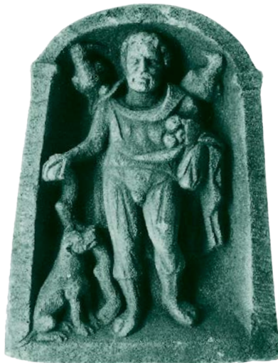
Рис. 48. Каменный рельеф с изображением лесного божества с собакой, палицей и открытой сумой, на плечах у которого сидят вороны, из Му, Бургундия (Франция)

Любопытным археологическим явлением позднего железного века на юге Британии является неоднократное ритуальное захоронение костей воронов. Давно известно, что люди, построившие городища в Уэссексе, выкапывали глубокие зерновые ямы для хранения семян в течение зимы, но впоследствии эти ямы