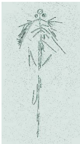
Рис. 47. Каменный рельеф железного века: человек-птица из долины Камоника (Италия). Шаманская практика ношения крыльев с перьями восходит к периоду свыше 5000 лет назад

в битвах, но вмешиваются в ход событий, вызывая напряженность между противоборствующими силами, провоцируя кровопролитие, и — вероятно, самое зловещее их свойство — в виде воронов клюют трупы павших на поле боя. Эти темные божества были озабочены прежде всего смертью, но также демонстрировали сексуальную ненасытность, пытались соблазнить молодых героев, например Кухулина, как мы уже видели (см. с. 126–128).