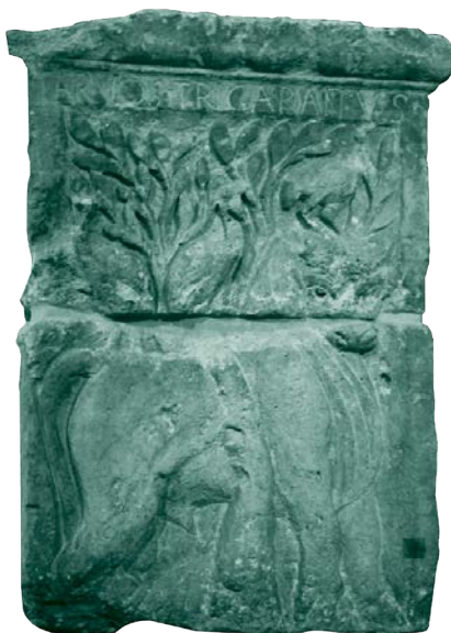
Рис. 49. Каменный рельеф с изображением быка по имени Тарв Тригаран и трех журавлей на памятнике в Париже, установленном Союзом лодочников в 26 году н. э.

наверняка Лукан говорил о том же Эсусе, который назван на памятнике из Парижа.