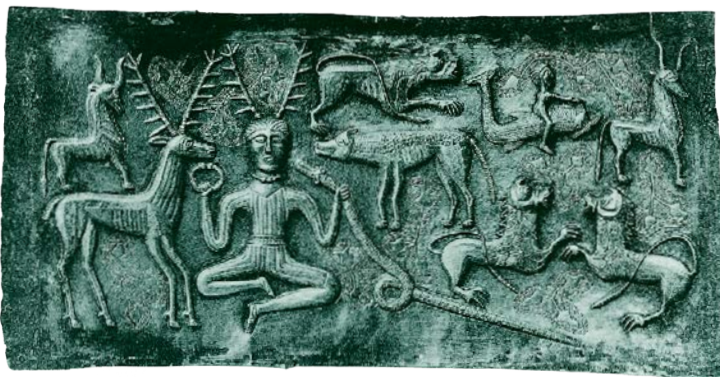
Рис. 44. Одна из внутренних серебряных пластин Гундеструпского котла (Дания) эпохи железного века с изображением божества с оленьими рогами, которое держит в руках змею с рогами барана

Проницаемость и размывание границ между людьми и животными, столь очевидные в мифологии, находят параллели в иконографии западноевропейского железного века и в искусстве эпохи римского господства. Образы строятся из сочетания несочетаемого: формы быков или кабанов могут задаваться