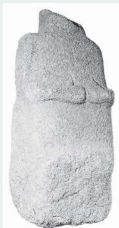
Рис. 42. Гранитная скульптура железного века из Ланньюнока (Бретань, Франция) с чрезмерно крупными поднятыми большими пальцами

большой палец может обладать особой духовной силой. История перекликается с валлийским преданием «Котел Керидвен» (см. с. 32), в котором юный слуга Гвион, помешивая магическое варево в котле, случайно обрел знания из-за того, что часть вещества попала ему на руку: на самом деле Керидвен готовила волшебное яство для своего злополучного сына Авагту.