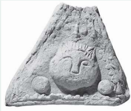
Рис. 45. Глиняный антефикс (фигурная черепица на углах кровли) в виде человеческой головы с кошачьими ушами из римского укрепленного лагеря легионеров в Каэрлеоне (Южный Уэльс)

Эти строки сохранились в тексте XII века. Его центральным персонажем был военачальник по имени Кайрбре Жестокий. Животные черты этого красавца, вероятно, указывали на звериную беспощадность жестокого завоевателя, но конкретный намек на кошек заслуживает особого внимания: это признак хитрости и скрытности. Однако поэт, вероятно, обращался и к древней шаманской традиции, согласно которой мужчины и женщины, проводившие церемонии, надевали костюмы животных, чтобы достичь близости с духами. Найденные в римской Британии глиняные черепки из Каэрлеона (Южный Уэльс) изображают человеческие головы с кошачьими ушами, а другая бородатая каменная голова с заостренными кошачьими ушами была обнаружена в Донкастере (Йоркшир).