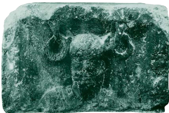
Рис. 46. Каменный рельеф: человеческая голова с оленьими рогами с подвешенными на них кольцами; памятник в честь Юпитера, установленный Союзом лодочников на Сене, Париж, 26 год н. э.

Гендерное смешение также присутствует в фигурах с оленьими рогами, так как на некоторых галльских бронзовых статуэтках изображены женщины с разветвленными рогами на головах. У нас нет точного имени для этого персонажа, однако есть одна подсказка благодаря изображению на резной каменной колонне из Парижа, установленной в 26 году н. э. в честь Юпитера. Среди множества античных и собственных галльских образов этого памятника можно найти бородатую голову с оленьими рогами, с каждого из которых свисает кольцо; над ним читается надпись «Кернунн» (Cernunno — «Рогатому»).