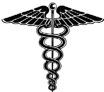
Рис. В.2. Кадуцей

Вы когда-нибудь видели кадуцей (символ врачебной профессии)? Это жезл, обвитый двумя змеями, с крыльями на вершине (рис. В.2). Жезл олицетворяет позвоночный столб; места пересечения змей — отдельные чакры , расположенные вдоль позвоночника последовательно от низших к высшим; змеи символизируют солнечную и лунную (мужественную и женственную) энергии в каждой из чакр .