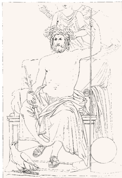
Могучий Зевс с молнией и орлом, в венке победы

По воле, мальчик, Зевса тяжкогромного Конец приходит к смертному. Не сами мы Судьбу решаем нашу. Кратковечные, Как овцы, мы проводим жизнь, не ведая, Какой конец нам бог готовит каждому. Семонид Аморгосский, Доля смертных, 1 (1)