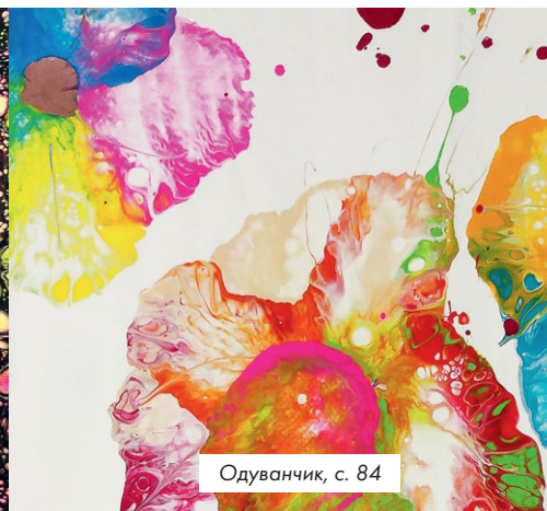
Одуванчик, с. 84