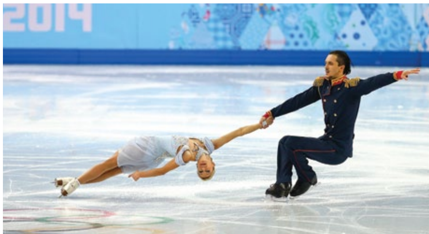
Татьяна Волосожар и Максим Траньков на Олимпиаде в Сочи, 2014 г.