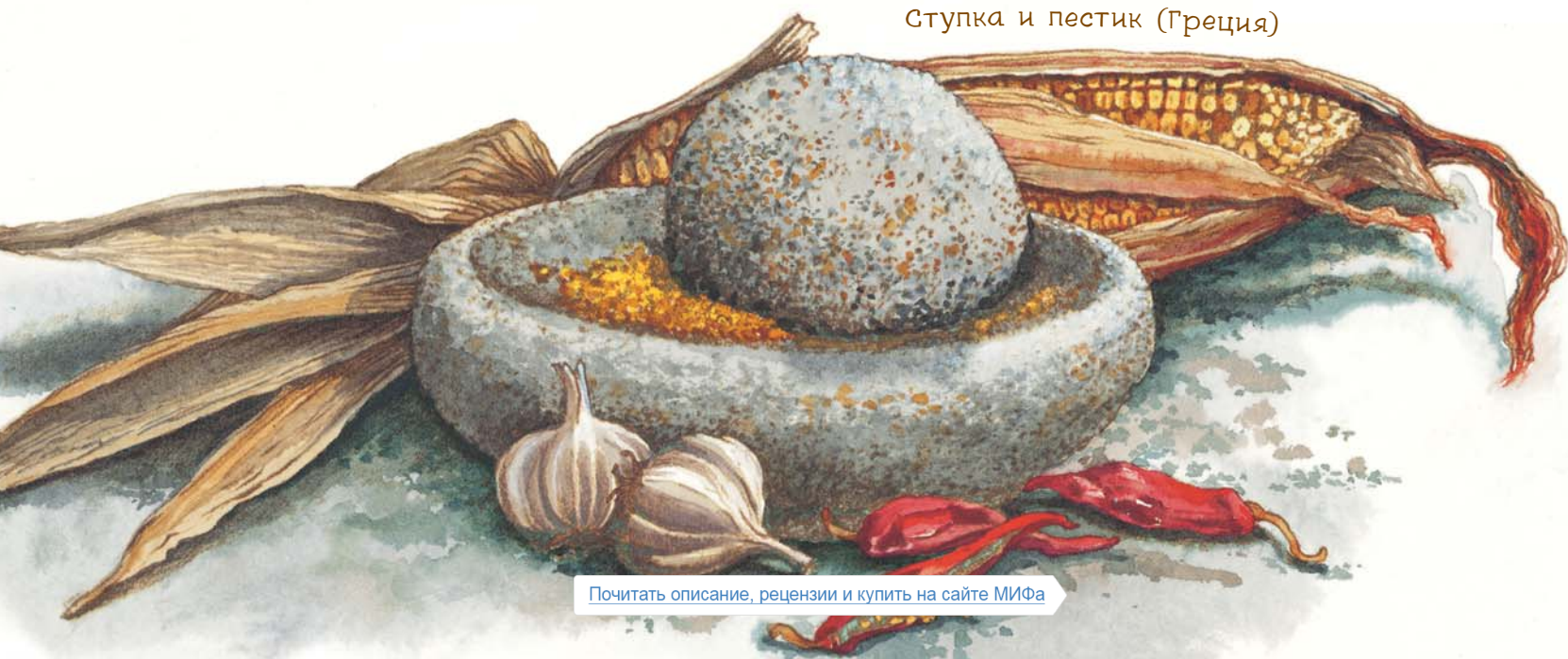
Ступка и пестик (Греция)

В доисторические времена люди изготавливали из камня орудия труда и оружие. Они обкалывали прочные камни вроде обсидиана и кремня, чтобы сделать из них острые топоры и наконечники для стрел. Из более зернистых камней, таких как песчаник и гранит, люди вытачивали ступки и пестики, с помощью которых измельчали зёрна пшеницы и кукурузы, орехи и чеснок.