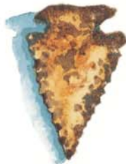
Наконечник стрелы (США)