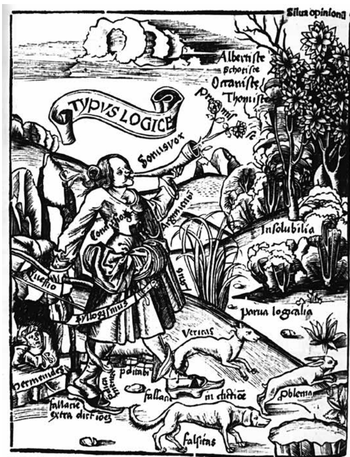
Грегор Рейш. Margarita Philosophica, 1503. Две собаки Veritas (лат. «истина») и Falsitas (лат. «ложь») преследуют зайца Problema (лат. «задача»), логика, вооруженная мечом силлогизма, спешит позади

Интересно, что это далеко не первый тектонический сдвиг, который происходит в сознании. Например, появление книги радикально изменило мышление