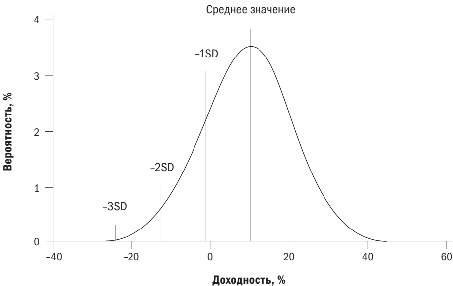
Рис. 1.2. Распределение доходности актива «А»

В качестве более простого примера рассмотрим фонд, состоящий из акций латиноамериканских компаний, с ожидаемой доходностью в 15% и очень высоким стандартным отклонением в 35%. Это сигнализирует о вероятности убытка в 20% или выше каждые шесть лет, убытка выше 55% каждые 44 года и убытка выше 90% каждые 740 лет. Очень сомневаюсь, что кто-либо из торговых агентов фонда или брокеров, продвигающих