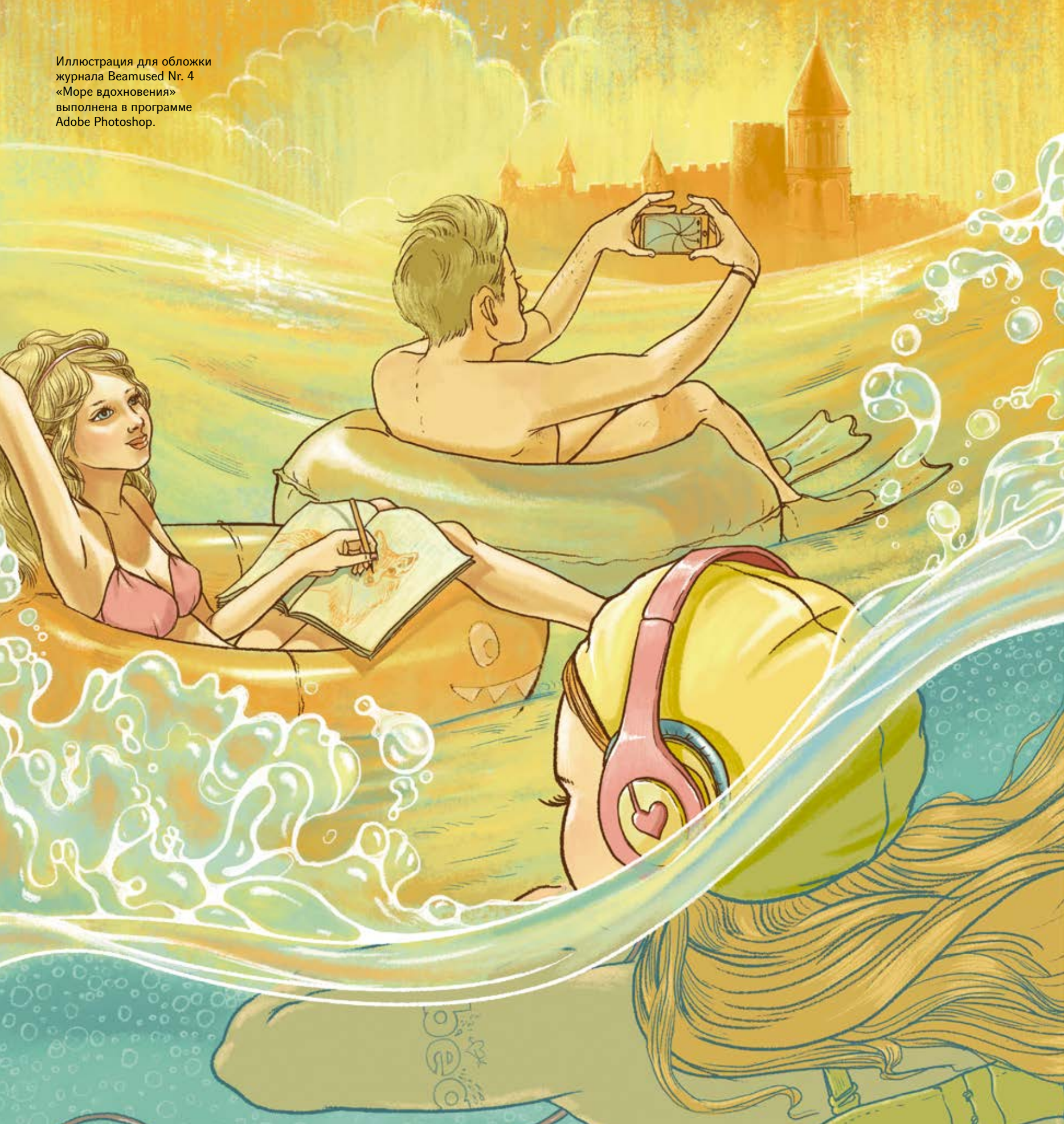
Иллюстрация для обложки журнала Beatused Nr. 4 «Море вдохновения» выполнена в программе Adobe Photoshop.