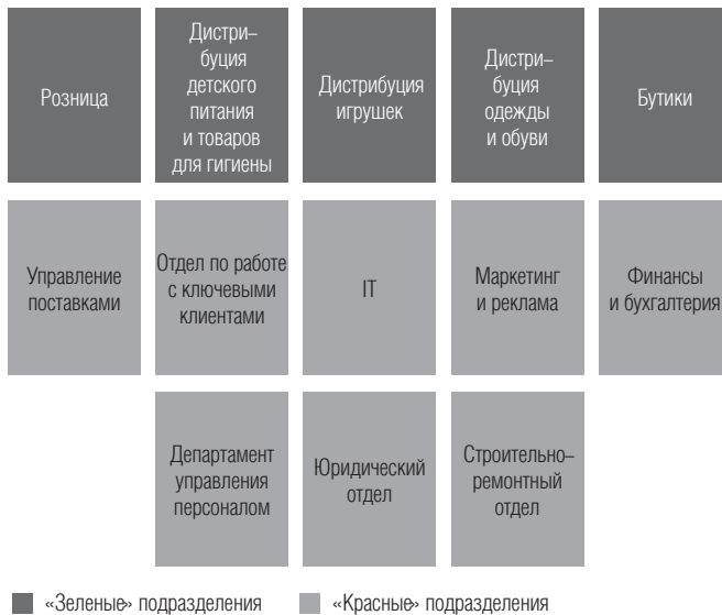
Рис. 2. Оргструктура концерна «Европродукт», 2008