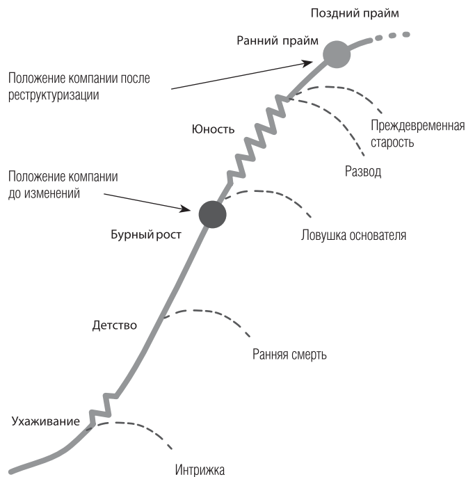
Рис. 1. Положение компании на кривой жизненного цикла до и после внедрения изменений

Методология Адизеса предлагает цикл из 11 шагов, которые могут привести компанию к расцвету. Первый из них — синдаг, а последний — разработка системы вознаграждений. Это четкий маршрут для перехода из бурного роста в юность. Мы наметили этот путь и начали по нему двигаться.