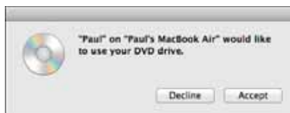
Рис. 2.5. Если вы пытаетесь использовать общий привод DVD удаленного компьютера Mac, пользователь этого компьютера увидит такое диалоговое окно