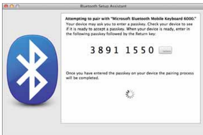
Рис. 2.11. Чтобы создать пару с некоторыми устройствами Bluetooth, необходимо ввести пароль