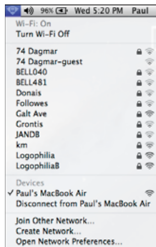
Рис. 2.2. Новая сеть ad hoc появляется в списке доступных беспроводных сетей

Чтобы подключиться к вновь созданной сети с другого компьютера Mac, нажмите значок «Состояние Wi-Fi» (Wi-Fi status) в строке меню и выберите имя сети, которое появится в разделе «Устройства» меню Wi-Fi (рис. 2.2). Если для сети был задан пароль, то программа попросит ввести его.