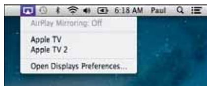
Рис. 2.7. Нажмите значок «Видеоповтор», затем значок Apple TV, чтобы изображение экрана MacBook Air появилось в телевизоре

Если телевизор имеет высокое разрешение, экран MacBook Air может отображаться на нем неправильно. Чтобы исправить это, выберите «Системные настройки» (System Preferences) ⇨ «Мониторы» (Displays) или нажмите значок «Видеоповтор» (Mirroring), а затем «Открыть настройки монитора» (Open Displays Preferences). Во вкладке «Монитор» (Display) выберите настройку «Наилучшее для AirPlay» (Best for AirPlay, рис. 2.8). Можно также использовать вкладку «Монитор» (Display) для видеоповтора, щелкнув значок «Видеоповтор» (Mirroring) во всплывающем меню.