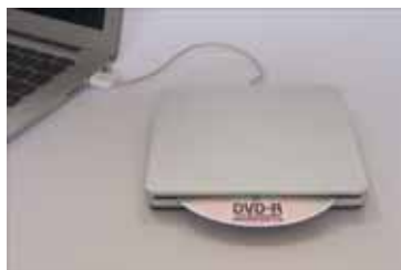
Рис. 2.3. Если на диске содержатся данные, которые невозможно получить из других источников, можно подключить к порту USB ноутбука MacBook Air устройство MacBook Air SuperDrive

У вас нет внешнего диска? Есть еще один вариант: взять другой компьютер и открыть на нем общий доступ к приводу DVD. После этого по сети с ним можно будет работать так, как если бы он был установлен в вашем компьютере.