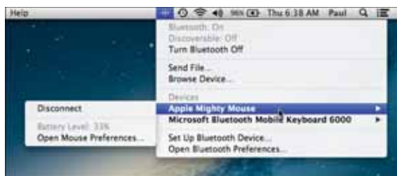
Рис. 2.12. Нажмите значок Bluetooth, а затем значок устройства, чтобы узнать уровень заряда батареи

В большинстве случаев устройства Bluetooth начинают работать сразу же. Однако возможности их обслуживания в MacBook Air ограничены. У большинства из них можно отслеживать уровень заряда батареи. Для этого нажмите значок Bluetooth, а затем значок устройства. Появляющееся меню содержит элемент, показывающий заряд батареи (рис. 2.12). Это меню можно использовать, чтобы войти в настройки устройства или отключить его.