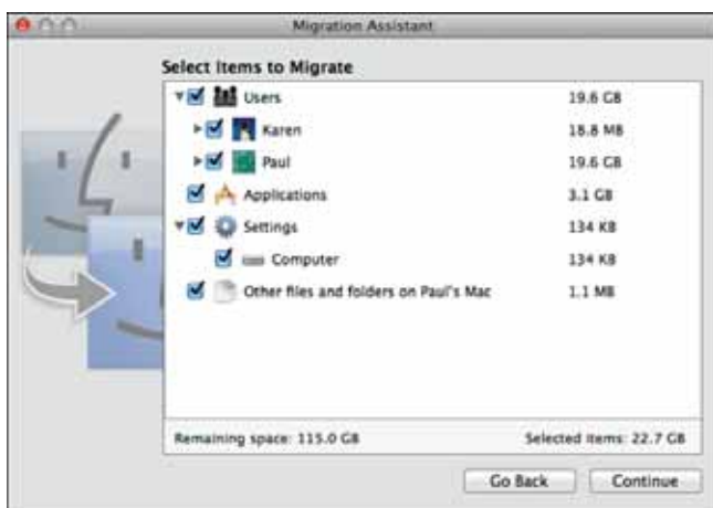
Рис. 2.9. Используйте диалоговое окно «Выберите объекты для миграции» (Select Items to Migrate), чтобы выбрать объекты, которые надо перенести на MacBook Air