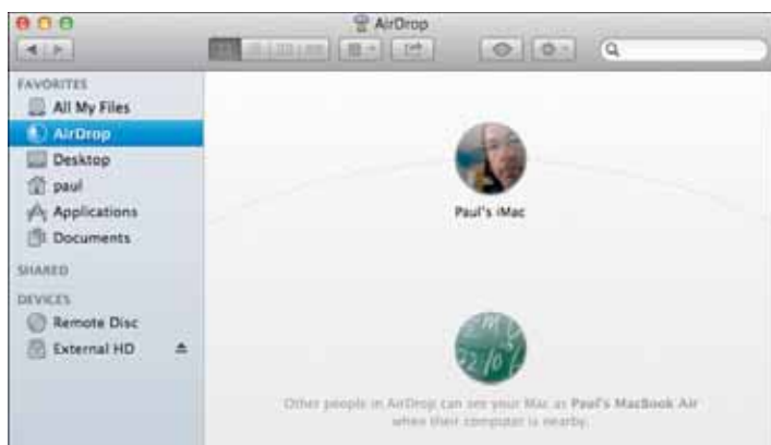
Рис. 2.6. Функция AirDrop показывает значки обоих компьютеров Mac