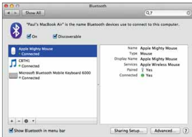
Рис. 2.13. Раздел Bluetooth окна «Системные настройки» показывает список устройств Bluetooth