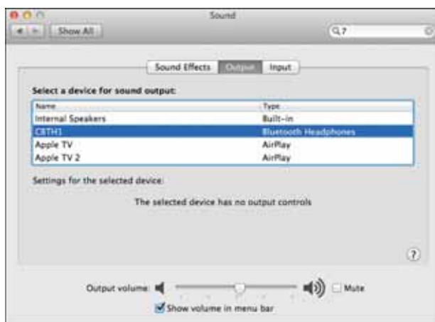
Рис. 2.14. Чтобы iTunes постоянно был с вами, укажите наушники Bluetooth в качестве устройства для вывода звука в MacBook Air