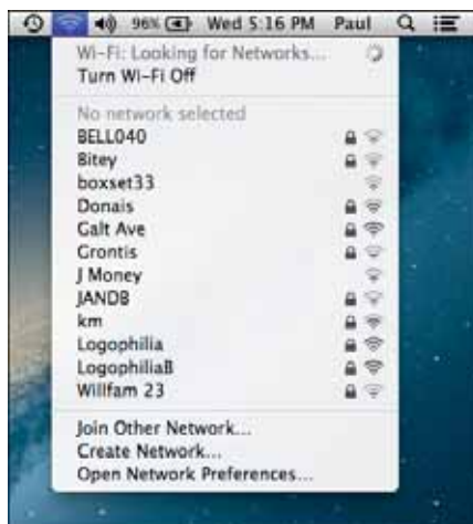
Рис. 2.1. В строке меню нажмите значок «Состояние Wi-Fi», чтобы увидеть список беспроводных сетей, находящихся в зоне досягаемости MacBook Air