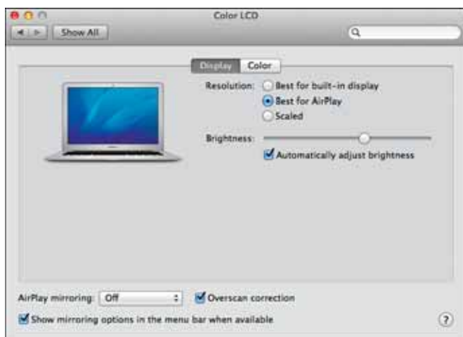
Рис. 2.8. Выберите «Наилучшее для AirPlay», чтобы обеспечить хорошее качество вывода изображения экрана MacBook Air на телевизор

Если телевизор имеет высокое разрешение, экран MacBook Air может отображаться на нем неправильно. Чтобы исправить это, выберите «Системные настройки» (System Preferences) ⇨ «Мониторы» (Displays) или нажмите значок «Видеоповтор» (Mirroring), а затем «Открыть настройки монитора» (Open Displays Preferences). Во вкладке «Монитор» (Display) выберите настройку «Наилучшее для AirPlay» (Best for AirPlay, рис. 2.8). Можно также использовать вкладку «Монитор» (Display) для видеоповтора, щелкнув значок «Видеоповтор» (Mirroring) во всплывающем меню.