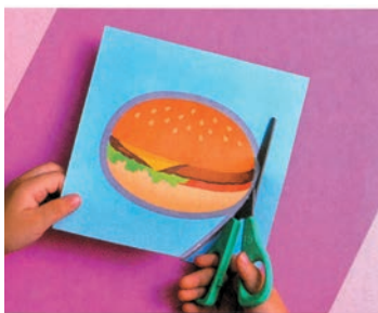
▲ Следите, чтобы ребёнок резал бумагу той частью лезвий, которая находится у самого их скрепления. Так у малыша будет получаться намного аккуратнее.

Чтобы вырезать аккуратно, нужно раскрыть ножницы и сделать сантиметровый разрез, затем продвинуть ножницы вперёд и сделать ещё один такой же разрез. Повторить действия необходимое количество раз.