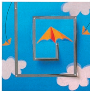
▲ Резать по линии, которая поворачивает под прямым углом, довольно сложно.

Не переживайте, если ребёнок не сможет с первого раза сделать ровный разрез или не сумеет остановиться в нужном месте. Напоминайте ему, что ножницы необходимо направлять вдоль линии разреза.