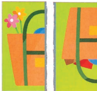
▲ Как правило, сначала дети режут бумагу неровно.

Прежде чем приступить к вырезанию, нужно научиться правильно работать ножницами. Проверьте, получается ли у ребёнка раскрывать и закрывать ножницы одним движением, держать их под верным углом к бумаге.