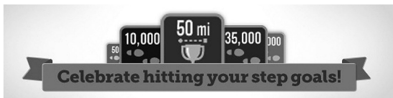
Рисунок 4.2 Бейджи Fitbit

[112] бейджами для всех возможных достижений. Пользователи могут открыть доступ к бейджу «Искатель приключений», как только зарегистрируются в десяти местах, данные о которых уже есть в системе Foursquare, а для получения бейджа «Полный отрыв» необходимо зарегистрироваться в четырех различных барах за одну ночь. (Никто ведь не говорил, что бейджи обязательно должны быть социально ответственными.)