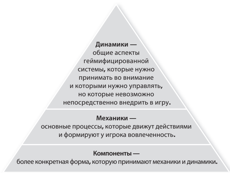
Рисунок 4.3 Динамика иерархии игровых элементов

и которыми станете управлять, но которые никогда [ 124 ] не сможете непосредственно внедрить в игру.