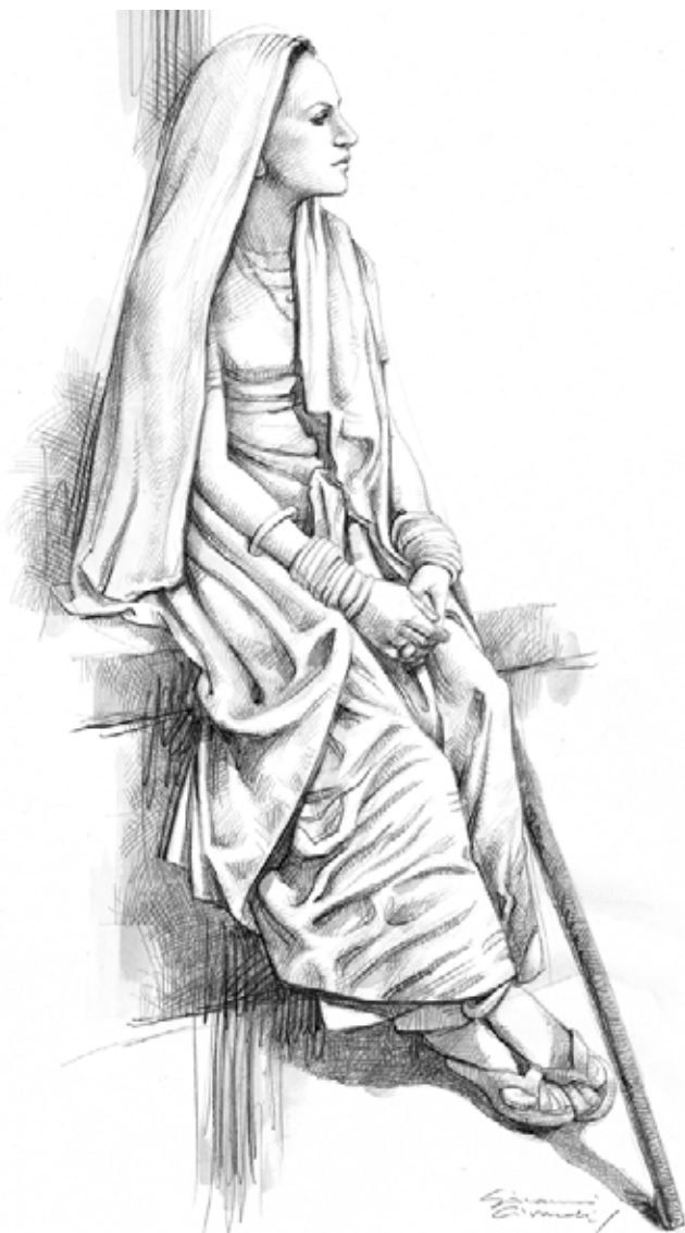
Женщина на рынке в Джайсалмере Графитовый грифель 2В и темпера оттенка жженой сиены на грубозернистой бумаге размером 33x48 см.

Многие художники привыкли брать в путешествие (наряду с камерой) альбом для рисования, чтобы бегом фиксировать наблюдения: пейзажи или архитектуру в укороченной перспективе, характер людей, замечания по цвету или композиции и так далее. Все, что привлекает внимание, следует быстро зарисовать и сохранить для будущей, более тщательной работы. На этих страницах я воспроизвел несколько рисунков, сделанных мною во время путешествия по Северной Индии; несмотря на то, что я был сильно ограничен во времени, терпение моделей (получивших вознаграждение в виде нескольких рупий) и в некоторых случаях благоприятные обстоятельства позволили мне сделать достаточно подробные зарисовки. Однако остальные рисунки (большая часть из всех, что я сделал) представляют собой простые наброски, сделанные за несколько минут (с. 169), и потому их можно отнести к категории эскизов, упоминаемых на с. 133.