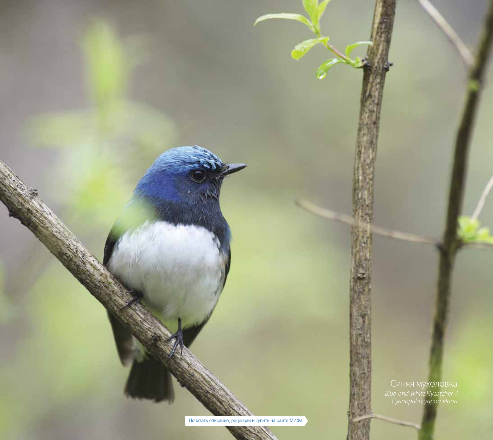
Синяя мухоловка Blue-and-white Flycatcher / Cyanoptila cyanomelana

Почитать описание, отзывы и купить на сайте МИФа