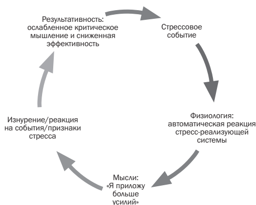
Рис. 1.1. Низкая стрессоустойчивость

Smart People Underperform («Когда система перегружена: почему преуспевающие менеджеры не могут работать в полную меру своих способностей»): «Бедняга сталкивается не с одним кризисом, а... с бесконечным потоком ситуаций, каждую из которых он воспринимает как небольшой кризис. Ощущение, что вы в западне, и желание соответствовать собственным стандартам и ожиданиям окружающих приводят к тому, что вы сжимаете волю в кулак, терпите и не жалуетесь — работы становится все больше, а результативность продолжает падать. Ваша реакция — “Я приложу больше усилий”. Вас не покидает чувство вины и легкой паники. Число задач растет как снежный ком, и на работе у вас постоянный аврал. Вы становитесь резким и нетерпимым, не можете сконцентрироваться ни на одной задаче, но продолжаете притворяться, что все в порядке... Вы настолько привыкли быть всегда “наготове”, что уже не замечаете того, что ваши механизмы приспособления попросту не работают» 1 . Если в последнее время на вас обрушилась лавина больших и маленьких дел, а вы при этом говорили себе: «Остановите поезд, я хочу сойти», то теперь вы знаете причину.