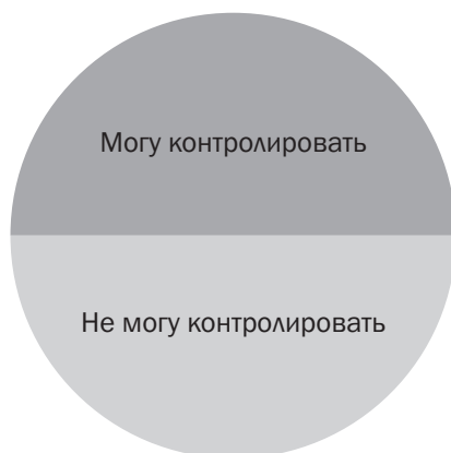
Рис. 2.2. Области контроля

Для начала давайте определим, какую часть обстоятельств вы можете взять под контроль, а какая от вас не зависит. Вспомните любую текущую ситуацию, которая вызывает у вас стресс. Внутри круга, изображенного на рис. 2.2, укажите, какими обстоятельствами вы можете управлять, а какими нет.