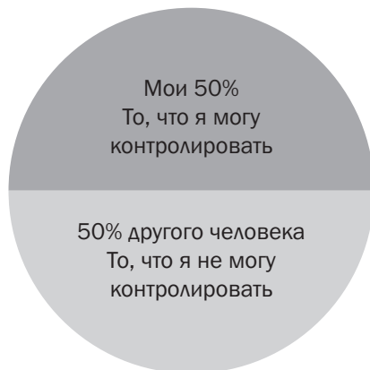
Рис. 2.1. Модель 50/50

государств. Но даже на личностном уровне есть множество факторов, влияющих на которые мы не в состоянии, — это и тон голоса собеседника, и то, что пишут нам в электронных письмах другие.