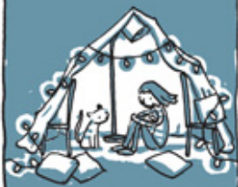
Домик из одеял