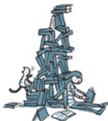
Великая стена из книг