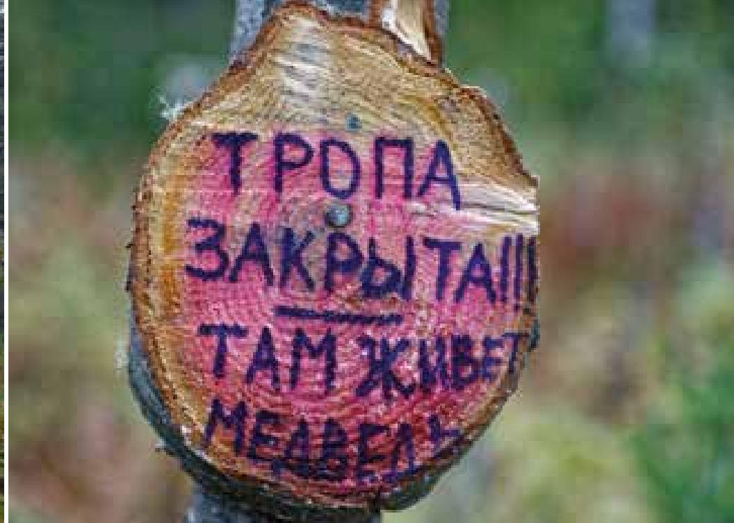
На Большой Байкальской тропе

Вскоре я выехал на Баргузинский тракт и возле Гремячинска опять встретился с Байкалом.