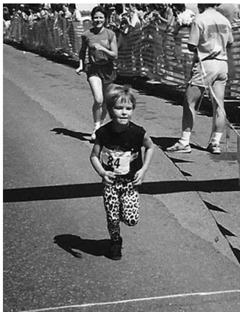
Я был бойким мальчиком и любил ездить с папой на забеги.

местечко в Денвере, но однажды в выходные оказались в Эвергрине во время ежегодного родео. Городок чем-то покори́л их — особенно отца, — и они решили пустить корни на Диком Западе. Чтобы завести юридическую практику в другом штате, требуются годы, и отец медленно шел к этому. В выходные он подрабатывал мойщиком окон, чтобы сводить концы с концами. Для меня до сих пор остается загадкой, как ему удавалось находить время в выходные, чтобы кататься со мной, тренироваться и мыть окна — но думаю, это тоже часть «хорошего психологического тренинга»: если хочешь, найдешь способ.