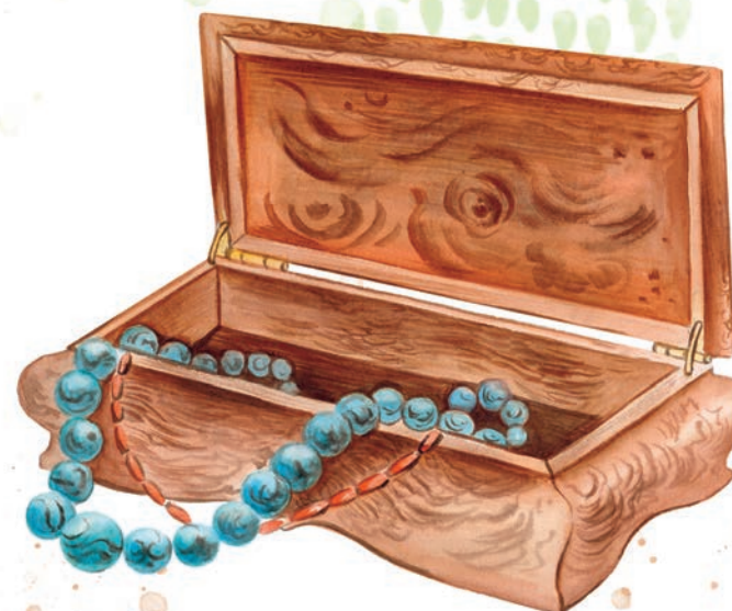
ШКАТУЛКА ИЗ КАРЕЛЬСКОЙ БЕРЕЗЫ

Ларцы и шкатулки из карельской берёзы очень ценятся за красивые узорчатые разводы. Думаете, это дерево растёт только в Карелии? Вовсе нет! Карельскую берёзу можно встретить везде, ведь это не особое северное растение, а обычная берёза с бугристыми наростами — капами. Появляются они, если дерево болеет. Волокна древесины в капах изгибаются и переплетаются, поэтому на спиле получается сложный узор. Для берёзы этот нарост — уродство, зато мастер-краснодеревщик может сотворить из такого дерева настоящую красоту!