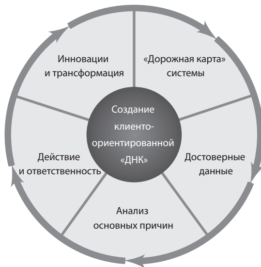
Рис. 1.3. Операционная модель системы Net Promoter