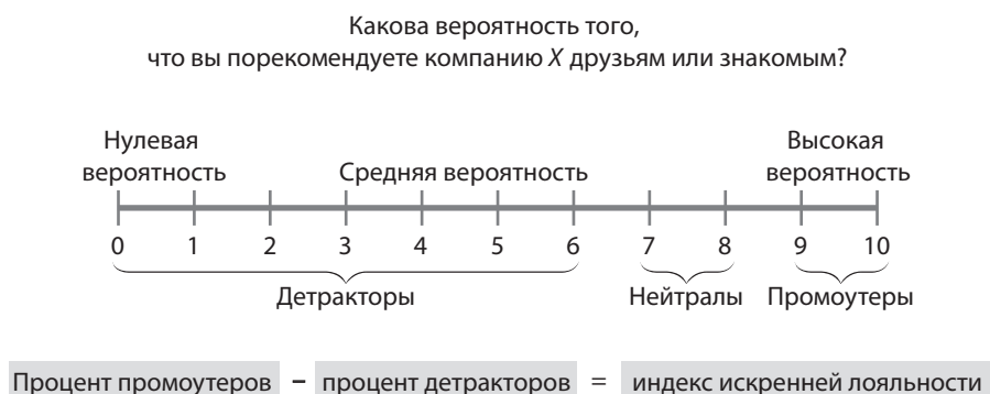
Рис. 1.1. Расчет индекса искренней лояльности

Чтобы рассчитать индекс искренней лояльности (NPS), нужно предложить респондентам оценить вероятность того, что они порекомендуют компанию друзьям и коллегам, по шкале от 0 до 10 баллов, где 10 баллов означает очень высокую вероятность, а 0 баллов — ее полное отсутствие. Расчет NPS сводится к определению разности между процентом тех респондентов, которые поставили 9 и 10 баллов, и тех, которые выбрали от 0 до 6 баллов (рис. 1.1).