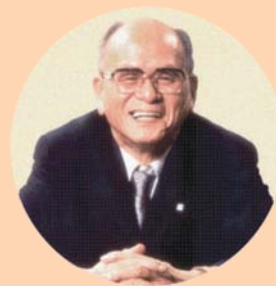
г-н Тору Кумон Основатель Kumon