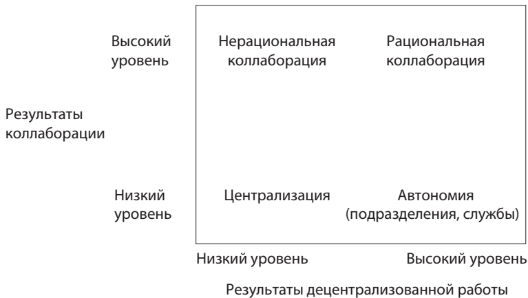
Рис. 1.3. Рациональная коллаборация. Высокие результаты от децентрализации и коллаборации

Компании, некоммерческие и правительственные организации, применяющие принципы рациональной коллаборации, достигают лучших результатов, чем при применении исключительно децентрализованного подхода. Это связано с тем, что при рациональной коллаборации сочетаются результаты работы самостоятельных отделов и результаты, полученные в ходе коллаборации. Как показано в этой книге, такие результаты сложно превзойти.