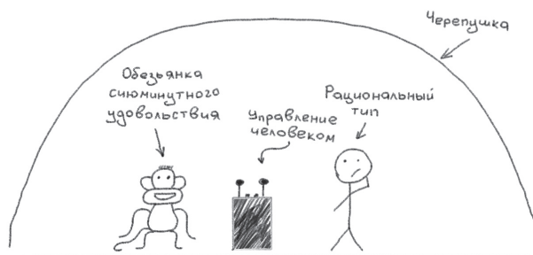
Рис. 1. Модель Тима Урбана

Как пишет Тим Урбан, наша обезьянка живет по законам обезьяньего мира, в котором ты успешная обезьяна, если ты ешь, когда хочешь есть, спишь, когда хочешь спать, и не делаешь ничего, что нельзя назвать веселым. Единственный, кого боится обезьянка, — это панический монстр (я безумно люблю Тима Урбана за его креатив). Панический монстр появляется незадолго до дедлайна или в любой другой момент, когда возникает угроза жизни, утраты лица или просто большой неудачи. Завидев панического монстра, обезьянка сбегает, оставляя у пульта рационального коллегу, и тот в панике в ночь с пятницы на понедельник ликвидирует опасность. Обычно он худо-бедно, ценой невероятных моральных и физических усилий успевает впритык к назначенному сроку.