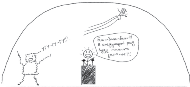
Рис. 2. Панический монстр